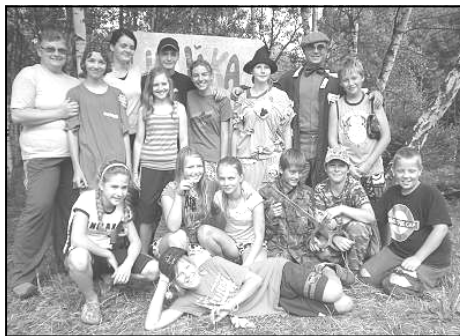
Děti si na táboře užily spoustu zábavy i nečekaných dobrodružství.

Druhý turnus, který se jmenoval Kaňka do pohádky a probíhal v posledním červencovém a prvním srpnovém týdnu, byl inspirován dětskými knížkami. Děti společně s vedoucími pomáhaly skřítku Šotkovi, aby se mohl vrátit do Země knížek a pohádek.