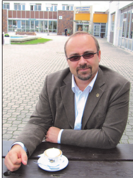
Rozhovor s předsedou Správní rady se odehrával u kávy v Kavárničce před nemocnicí.

Obdobnou otázku jsem již obdržel při svém nástupu do naší nemocnice. Nemyslím, že bude má současná odpověď jiná, ale jistě bude přesnější. Přeji si nejen udržení dlouhodobé ekonomické stability, která je odrazem skvělé spolupráce a odpovědného přístupu všech zaměstnanců, ale také si přeji, aby naše nemocnice zvyšovala svůj odborný kredit a vliv v regionu. Rád bych pokračoval v započatém intenzivním rozvoji nemocnice a v její další modernizaci. Úspěšné